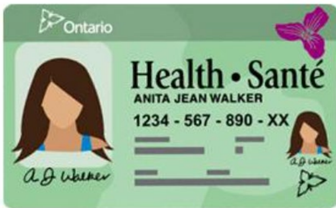
Figura 1. Tarjeta de salud del OHIP

Deberá presentar una tarjeta de salud del OHIP (Figura 1) para acceder a servicios de salud a fin de demostrar que cuenta con cobertura del OHIP. No debe pagar nada por obtener una tarjeta de salud de Ontario ni por recibir servicios de salud plenamente cubiertos por el OHIP .